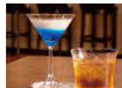
ロビーラウンジ La saison