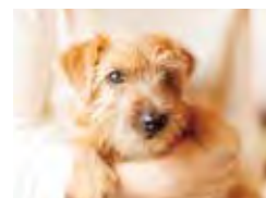
ペット対応ルーム