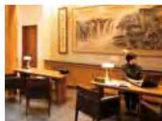
コンシェルジュデスク

日本画家の郷間正観氏による書画がエントランスから各部屋に至るまで展示されており、さながら「郷間美術館」といえるほどです。